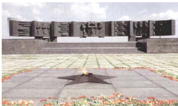
Мемориал в честь героев Курской битвы. Белгородское направление Скульптор А. И. Гребенюк, В. И. Казак, В. Д. Леус