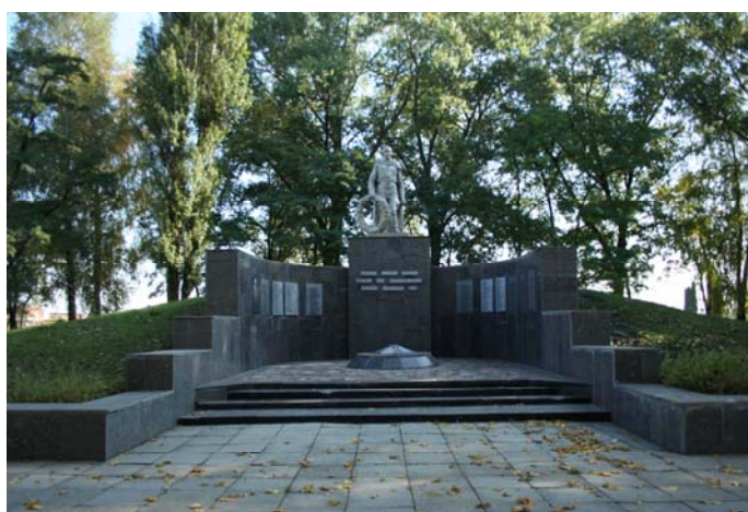
Братская могила советских воинов (656 км автомагистрали Москва – Симферополь, у аэропорта)