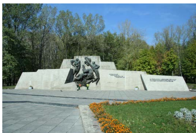
Памятный знак жертвам фашизма Скульпторы А. А. Шишков и А. А. Пшеничный, архитектор А. В. Берсенов