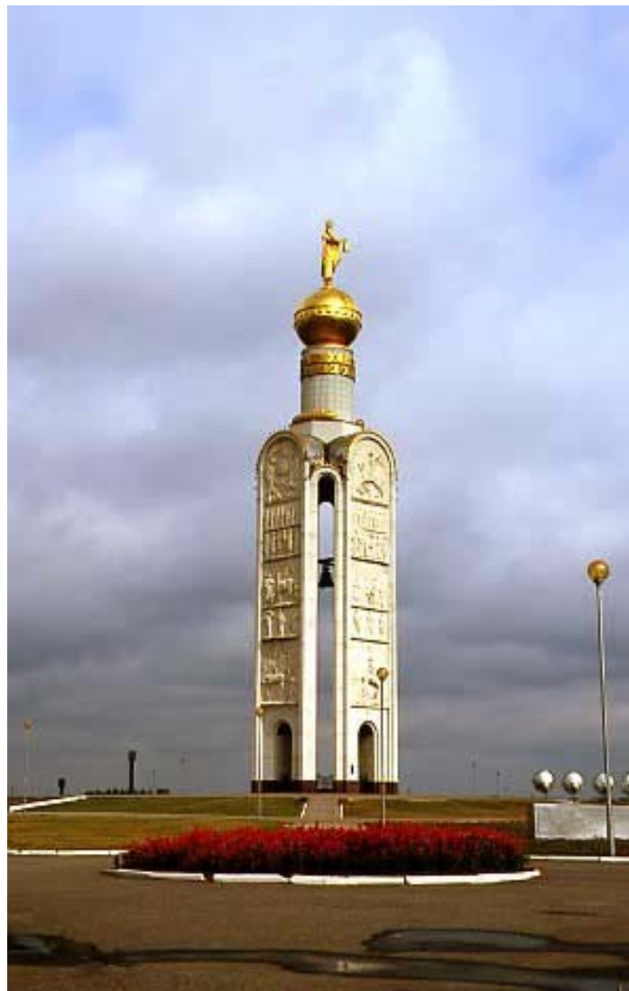
Памятник Победы – «Звонница» на Прохоровском танковом поле. Скульптор В. М. Клыков, архитектор Р. И. Симерджиев, инженер К. Г. Силохин