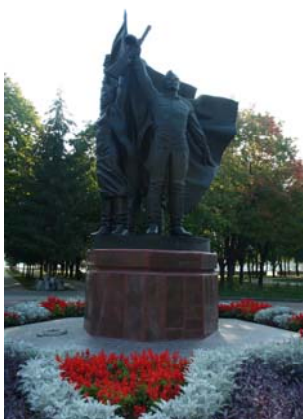
Скульптурная композиция «Победа в Великой Отечественной войне» Скульптор В. А. Чухаркин, архитектор С. С. Михалев