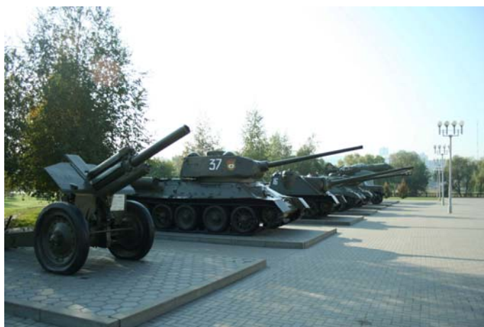
Экспонаты под открытым небом Музей-диорама «Курская битва. Белгородское направление»