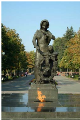
Мемориальный комплекс «Слава героям!» Скульптор Г. В. Нерода, архитектор И. А. Француз