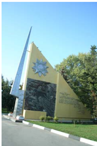
Монументальная стела с текстом Указа Президиума Верховного Совета СССР «О награждении города Белгорода орденом Отечественной войны I степени» за мужество и стойкость, проявленные белгородцами в годы Великой Отечественной войны