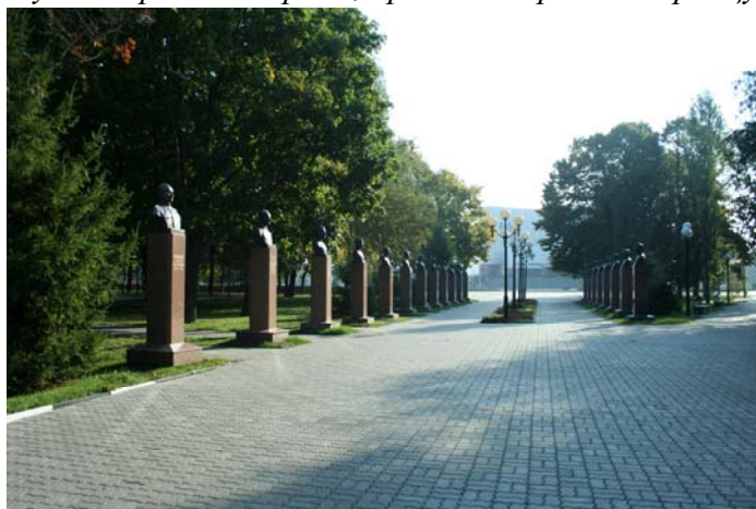
Аллея Героев Советского Союза и Героев России, уроженцев Белгородчины. Скульпторы Д. Ф. Горин, А. А. Пшеничный, А. С. Смелый, А. А. Шишков