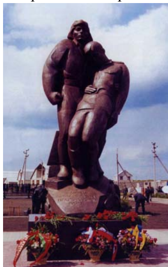
Памятник «Воинам, павшим на Прохоровском поле». Скульптор Ф. М. Согоян.