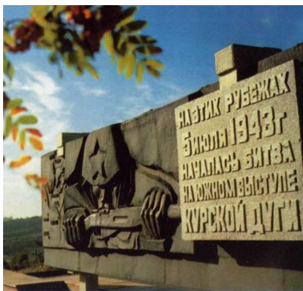
Памятный знак на переднем крае главной полосы обороны 6-й гвардейской армии Скульптор Д. Ф. Горин