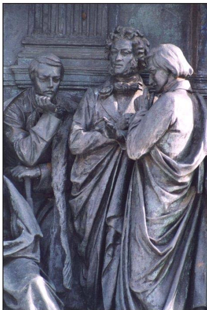
Великий Новгород. Кремль. Лермонтов, Пушкин и Гоголь Фрагмент памятника к 1000-летию России

• Андроников И. Л. Гоголь и его современники / Ираклий Андроников // Великая эстафета : воспоминания, беседы / оформ. А. Ганнушкина. – 3-е изд. – М. : Дет. литература, 1988. – 335 с. : фотоил.