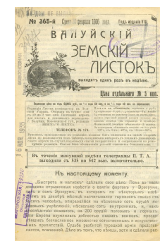
Редкие краеведческие издания