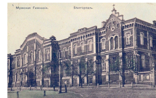
Белгородская мужская классическая гимназия