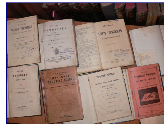
Учебники по русскому языку и литературе