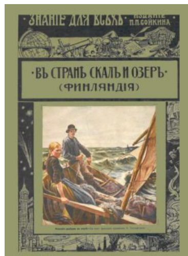
Знание для всех, 1914 г.

Одна из наиболее популярных серий - «Знание для всех». Каждый выпуск этой серии представляет собой отдельную на-