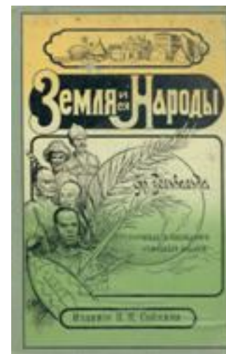
Земля и народы, 1898 г.