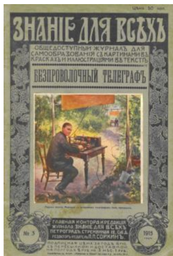
Знание для всех, 1915 г.