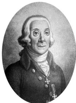
Петер Симон Паллас 1741–1811