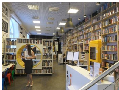
Зал художественной и отраслевой литературы

В библиотеке ежегодно проходит Гоголевская неделя, которая состоит из тематических мероприятий, посвященных современным интерпретациям и осмыслению творчества Н. В. Гоголя. В 2015 году прошла первая студенческая научная конференция «Гоголь Today», направленная на актуализацию темы творчества Н. В. Гоголя и изучение современных взглядов на классические произведения.