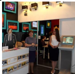
Холл Центральной районной библиотеки им. Н. В. Гоголя

произведения. На сайте библиотеки не только размещены аннотации книг о Н. В. Гоголе, но и предоставлен доступ к электронной версии издания. В разделе «Мероприятия» специалисты библиотеки отражают наиболее интересные мероприятия, связанные с именем Н. В. Гоголя, которые проходят в библиотеке, театрах (спектакли), музеях и т. д. В библиотеке проводятся научно-практические конференции,