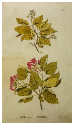
Описание растений Российскаго государства с их изображениями, по всевысочайшему повелению, и на иждивении ея имп. величества, изданное П. С. Палласом. 1786

Несмотря на солидный возраст, книга Палласа до настоящего времени не утратила ценности для людей науки, профессионально занимающихся ботаникой и биологией. Однако подобные раритетные издания не могут находиться в свободном доступе для читателей. Учитывая возраст и физическое состояние, они должны храниться в строго определенных условиях, создать которые можно исключительно в специальных хранилищах. Сделать книгу доступной для широкого круга читателей поможет оцифровка. В настоящее время сотрудники библиотеки работают над созданием электронной копии книги П. С. Палласа, которая в скором времени получит новую виртуальную жизнь.